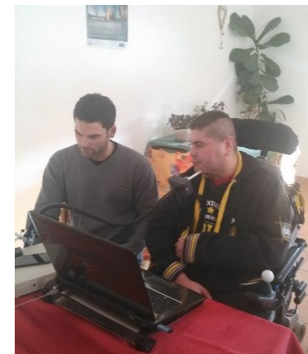
↑ Ústní myš i logopedie pomáhají ↓ v každodenním životě pacientů.

Díky ústní myši (MouthMouse®), specializovanému zařízení moravskoslezské firmy Benetronic, jsou pacienti Domova sv. Josefa s výrazně omezenou hybností dolních i horních končetin schopni lépe komunikovat s rodinou (přes skype atd.) i s okolím (zesilovač hlasu apod.) a dokonce i schopni získat zaměstnání. Odborně vyškolený personál pomáhá hendikepovaným znovu do života.