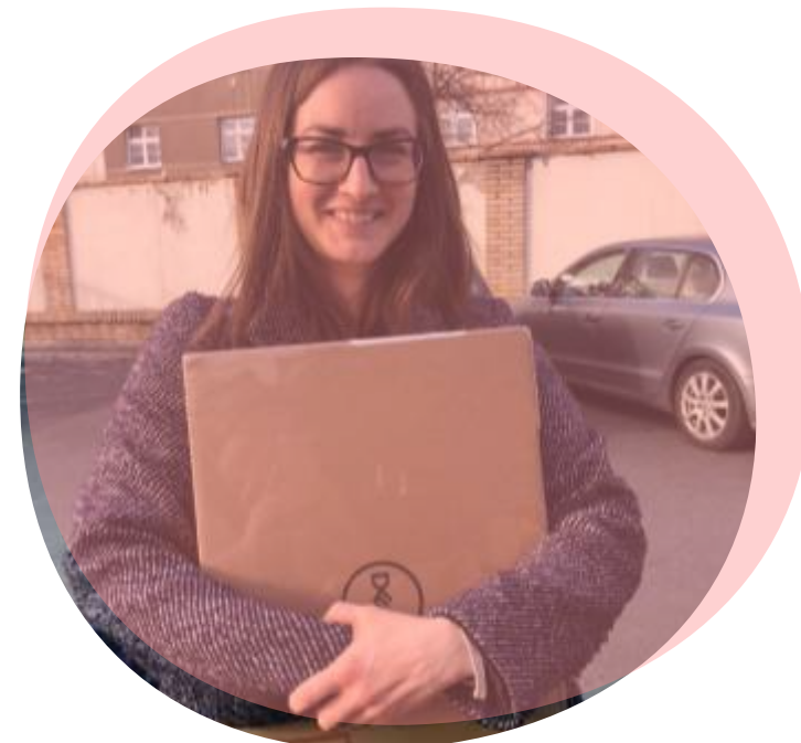
Koordinátorky sociální a zdravotní péče v krajích ČR