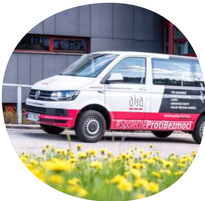
Mobilní multidisciplinární tým